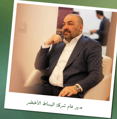
مدير عام شركة البساط الأخضر