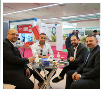
من لقاءات طاقم عمل البساط الأخضر مع العملاء