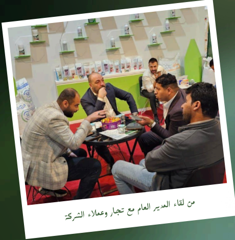
من لقاء المدير العام مع تجار وعملاء الشركة

شهد جناحنا حضوراً واسعاً من المزارعين والمهتمين بالقطاع الزراعي، حيث استعرضنا أحدث منتجاتنا من الأسمدة والحلول الزراعية، وعززنا التواصل مع شركائنا وعملاءنا في السوق.