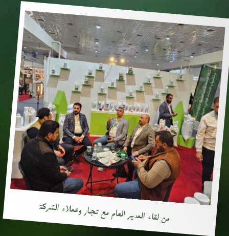
من لقاء المدير العام مع تجار وعملاء الشركة