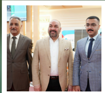
من لقاء المدير العام مع تجار وعملاء الشركة