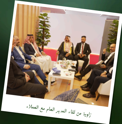
زاوية من لقاء المدير العام مع العملاء