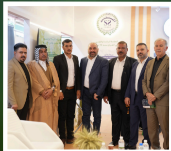
من لقاء المدير العام مع تجار وعملاء الشركة