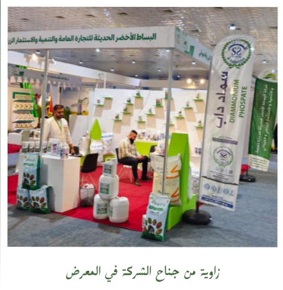
زاوية من جناح الشركة في المعرض