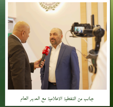
جانب من التغطية الإعلامية مع المدير العام