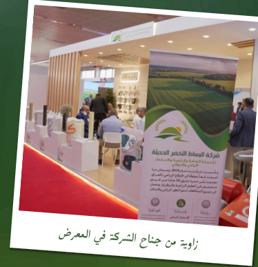
زاوية من جناح الشركة في المعرض