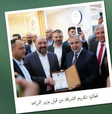
فعالية تكريم الشركة من قبل وزير الزراعة